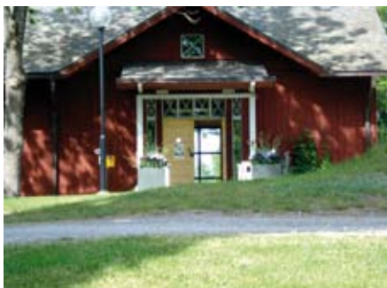
Dalslands konstmuseum i sommargrönska.

– Därför att det händer mycket spännande på det textila området just nu. Många yngre visar ett aktivt intresse för textila hantverk. Och museer i både Stockholm och Göteborg, satsar på stora textilutställningar. Det startas nya nordiska textila nätverk och inom den internationella samtidskonsten finns textilen med som ett självklart uttryck. Då är det roligt att kunna ställa ut två av Finlands främsta textilkonstnärer och samtidigt visa tre svenska vävare som trotsat alla trender och envist hållit fast vid sitt material sedan 70-talet, då vi hade den förra textila vågen. Jag tror vi är precis i början av en ny sådan trend.