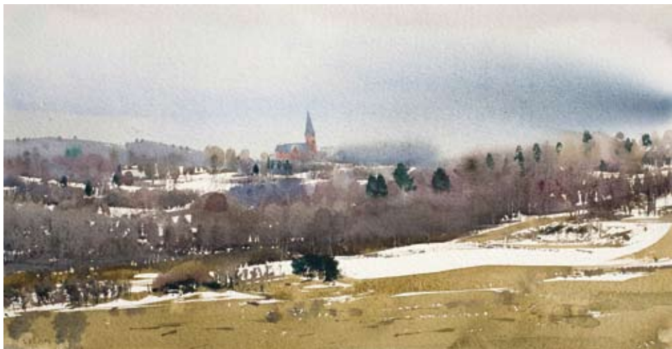
Forts. Stanislaw Zoladz

– Ljuset är helt annorlunda här, mycket skarpare och mer kontrastrikt än längre söder ut.