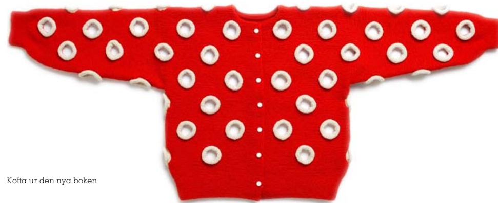
Kofta ur den nya boken