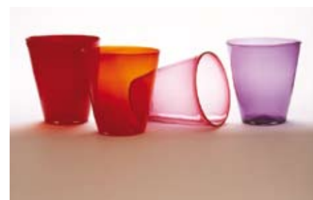
Färgade glas av Kerstin Paulsrud.

Det är inte så lätt att sälja handblåst bruksglas idag. Konkurrenten med det maskintillverkade är hård. Handblåst blir förstås dyrare, men man får mer för