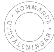
Carl Oscar Borg