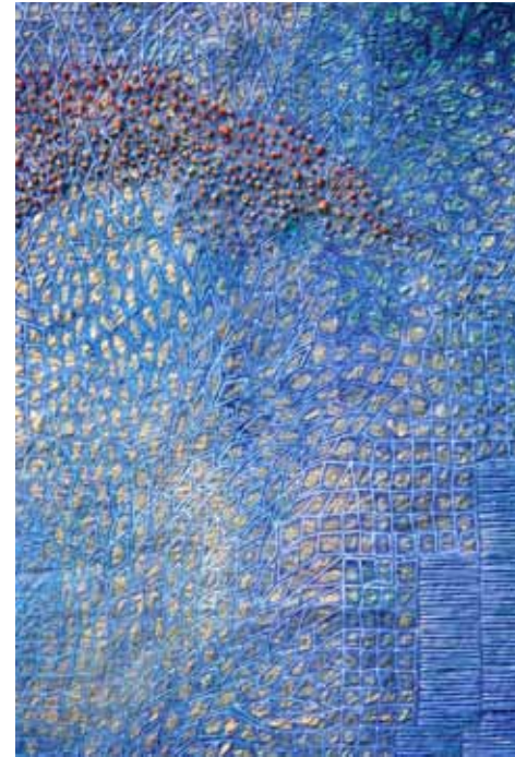
Detalj av broderi