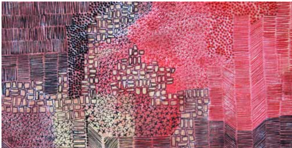
Detalj av broderi