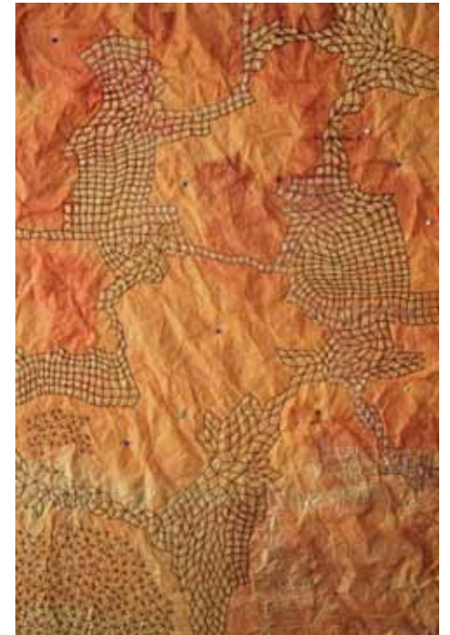
Detalj av broderi

Utställningen visas i Galleriet och pågår till den 12 december.