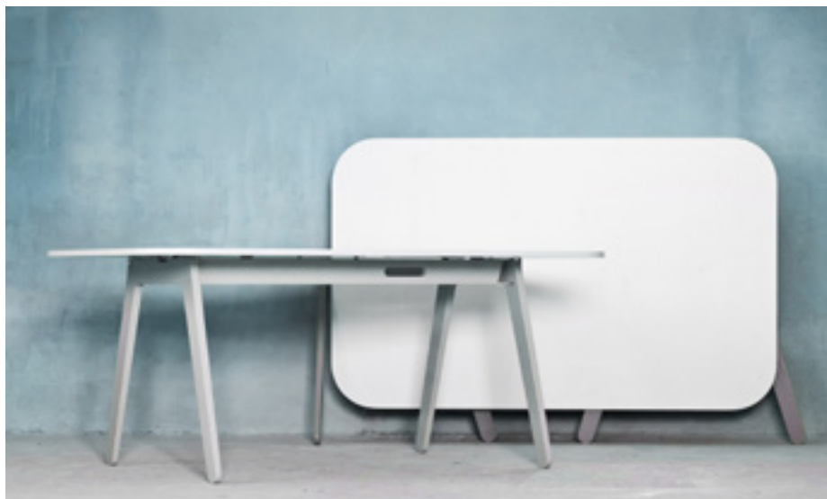
Bord av Akka

I april månad pågår möbelmässan i Milano och då sjuder hela staden av aktivitet. Designers, producenter, inköpare och journalister från hela världen är samlade för att ta del av årets designnyheter. På plats i år fanns flera unga, västsvenska designers.