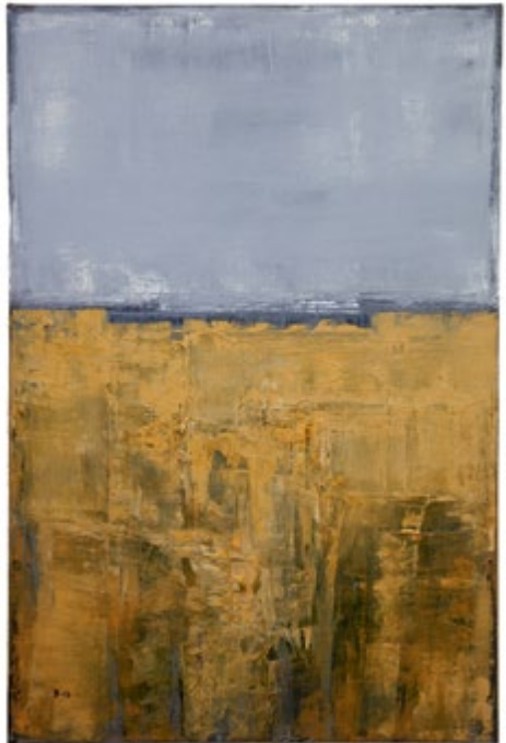
»Bilder från Ingenmansland II«

Utställningen visas i övre utställningshallen och pågår t.o.m. 12 maj.