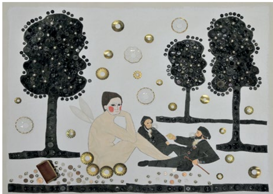
»Frukost i det gröna«

utställningar sedan dess, också utomlands, och många statliga stipendier har stött hennes väg. Hon finns representerad på flera av landets största museer. Vid sidan om det fria skapandet har Hemslöjdsrörelsen varit en återkommande uppdragsgivare, för dem har hon bland annat ritat textila mönster och gjort utställningar.