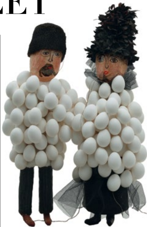
»Vad många vi blev«