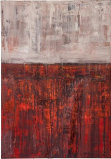
»Bilder från Ingenmansland I«

det föränderliga ljuset och alla sjöar och myrar som skapar öppna ytor. Det är förutsättningen för mitt måleri.