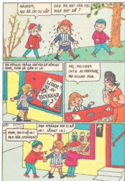
Ur Klumpe Dumpe

träffat på akademien och de fick en son. Äktenskapet varade inte länge, 1942 tog hon sonen och flyttade till Stockholm.