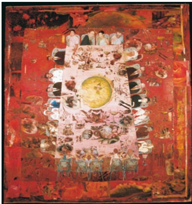
»The Baroque Party«

– De innehåller så många roliga detaljer. Bårder, ornament och överraskande karaktärer dyker upp på de mest oväntade ställen i dessa ganska så pretentiösa bilder. Till exempel små apor som