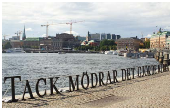
Tack mödrar det gjorde ni bra på Skeppsholmen augusti 2015.