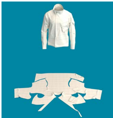
Atacac shareware no. 24 The Pod driver jacket.

– Snabbhet mellan design och färdigt plagg är ett måste, menar de båda.